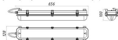
Рисунок 1 Светильник «L-sub 45»

1.5 Общий вид и габаритные размеры светильника показаны на рисунке 1.